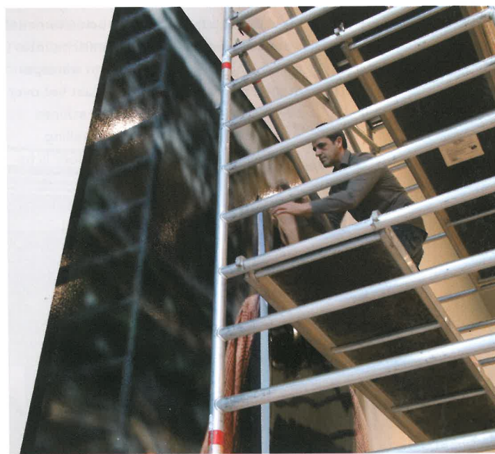
De grootste formaten dienden te worden 'getuiled', waarna de delen op locatie aan elkaar werden gezet.

Ter gelegenheid van de twintigste editie van filmfestival 'Open Doek' in het Belgische Turnhout vindt in het Kunstforum Würth Turnhout de tentoonstelling 'Open Asia' plaats met foto's van Kris Dewitte. Deze fotograaf heeft zich gespecialiseerd in setfotografie, meestal op Europese filmsets. Voor deze tentoonstelling is hij verschillende keren naar Azië gereisd om een sterke reeks kleurenfoto's te nemen op Aziatische filmsets. Met 57 filmsetimpressies en 17 portretten van actrices legt Dewitte de nadruk op stillsfotografie. Op verschillende locaties in Taiwan, Thailand en Singapore woonde hij filmopnames bij. Wat je op de tentoonstelling te zien krijgt, zijn niet direct de eigenlijke filmstills, maar sfeerbeelden die tijdens de draaidagen zijn genomen. De momenten die net geen filmstill zijn, maar impressies van een fotograaf die het opnameproces van zeer dichtbij volgt. >>>