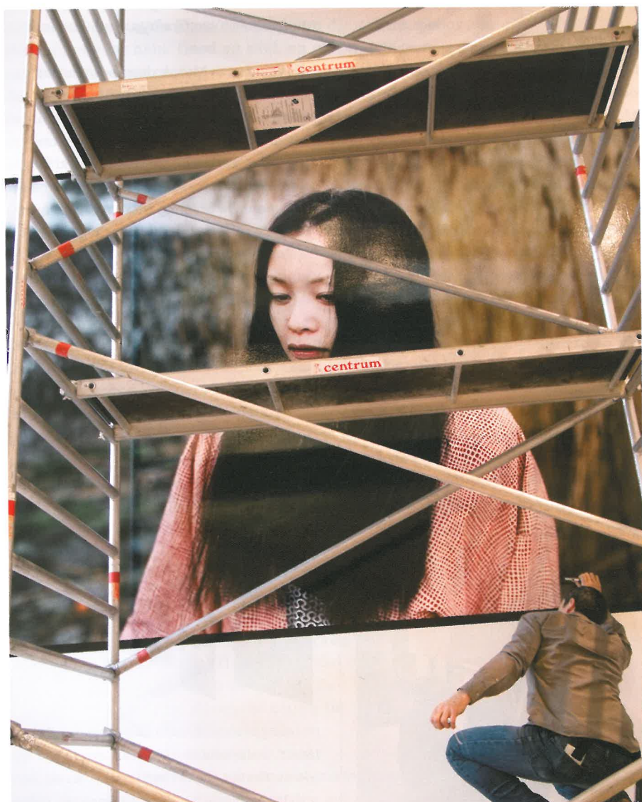
De muur blowups zijn door Mutoh geprint op zelfklevende folie S12R van Grafityp, waarna LAM 170 laminaat is aangebracht. Als drager is gekozen voor 3 mm Dibond platen.

Op een tentoonstelling in Turnhout, België, is werk te zien van fotograaf Kris Dewitte. Het betreffen sfeerbeelden die tijdens draaidagen op Aziatische filmsets zijn geschoten. In samenwerking met Mutoh zijn de digitale grootformaat prints tot stand gekomen.